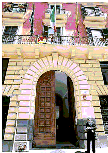
I NODI il palazzo del Consiglio, sotto de Magistris

Intanto il Comune sta facendo ancora i conti con gli ingenti danni subito dopo l'ondata di maltempo che ha devastato la città nei giorni scorsi. Ieri mattina il primo cittadino ha inviato una lettera al presidente del Consiglio Giuseppe Conte sulla tempesta del 29 ottobre, definita una sorta di «terremoto atmosferico», per i danni arrecati ad edifici, scuole e alberi, che ha provocato anche «il drammatico episodio della morte di uno studente».