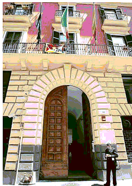
I NODI Il palazzo del Consiglio, sotto de Magistris

Intanto il Comune sta facendo ancora i conti con gli ingenti danni subito dopo l'ondata di maltempo che ha devastato la città nei giorni scorsi. Ieri mattina il primo cittadino ha inviato una lettera al presidente del Consiglio Giuseppe Conte sulla tempesta del 29 ottobre, definita una sorta di «terremoto atmosferico», per i danni arrecati ad edifici, scuole e alberi, che ha provocato anche «il drammatico episodio della morte di uno studente».