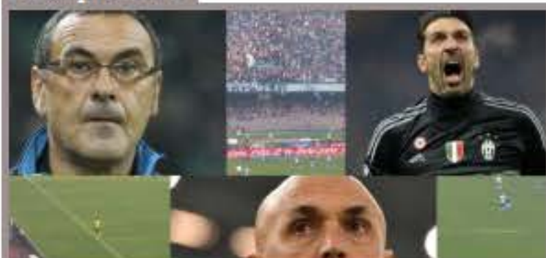
Inter in Champions! Sarri e Buffon due... addii?