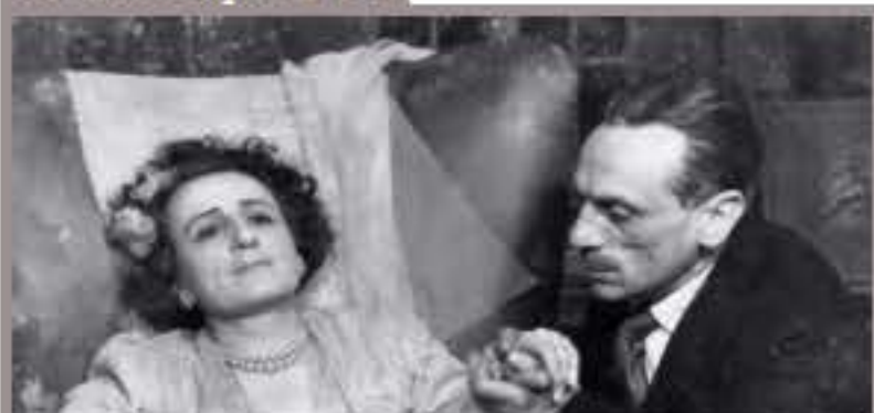
Eduardo de Filippo e John Rawls, analogie e coincidenze sul "Velo dell'ignoranza"