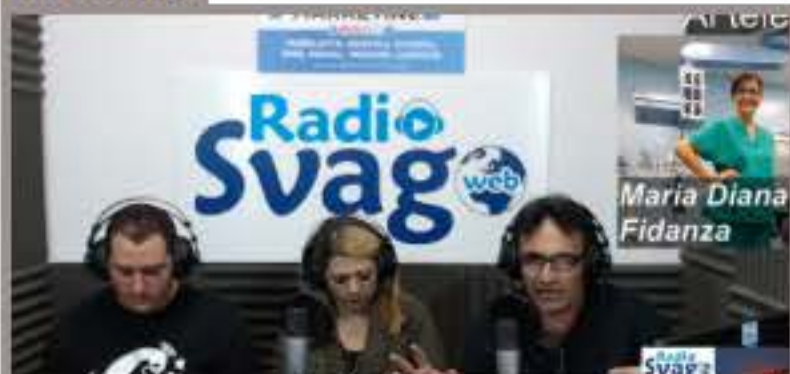
Buone notizie su Radio Svago Web con "Oltre l'Ostacolo"